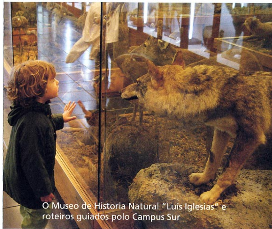
O Museo de Historia Natural "Luís Iglesias" e roteiros guiados polo Campus Sur